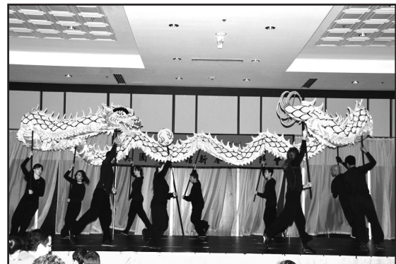
威風凜凜的舞龍氣勢磅礴