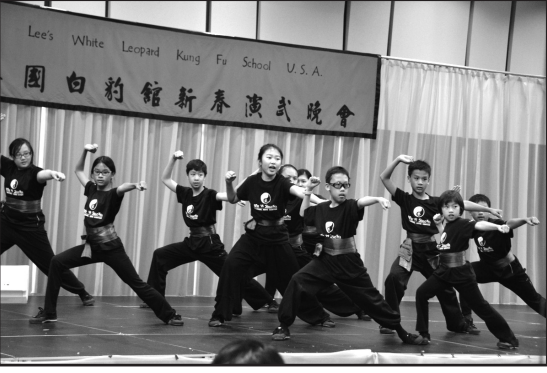
少林功夫青出於藍