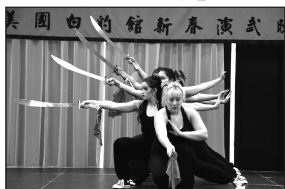
架式十足的刀法表演