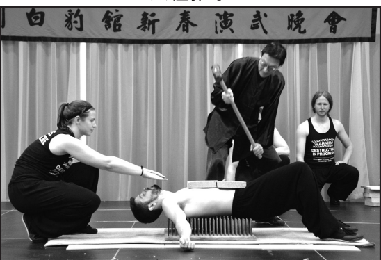
胸口碎大石，內力深厚紮實