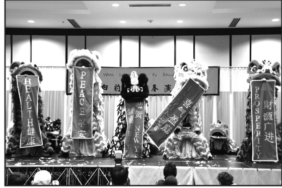
舞獅會串，寓意吉祥