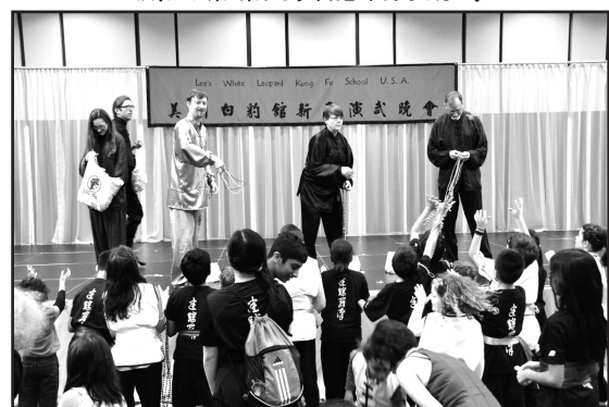
來自路易斯安納州的代表們發送狂歡節項鍊