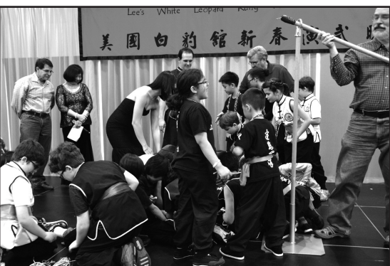
Pinata遊戲是小朋友的最愛