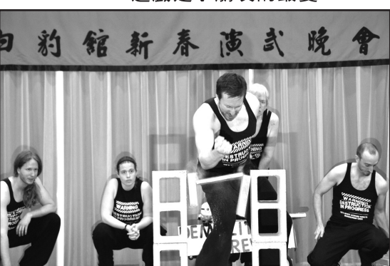
空手破磚，贏得滿堂掌聲