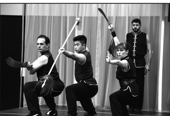
白豹館門生架式十足